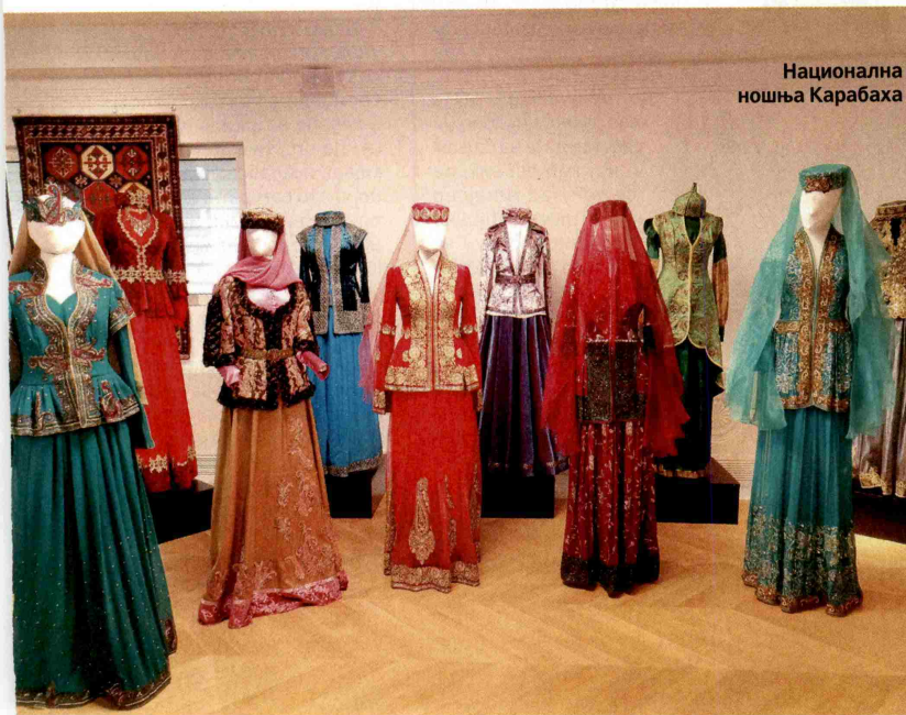
Национална ношња Карабаха

Град Шуша престоница је културе ове земље, а ове године званично и турског говорног подручја