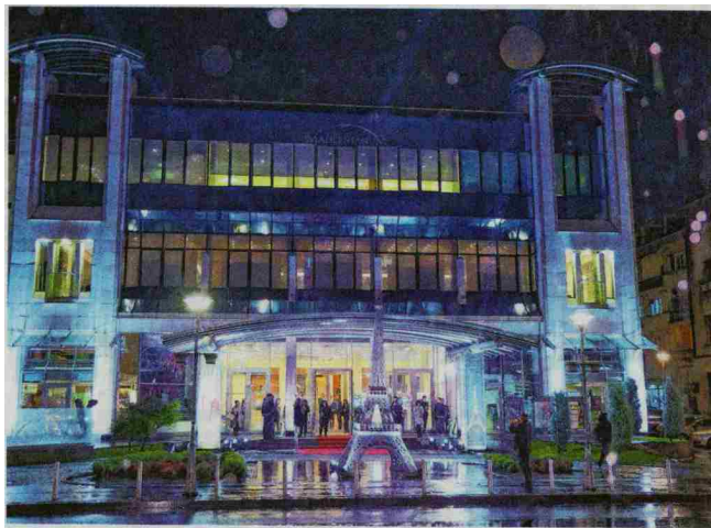
Zemunski teatar Madlenianum ove godine obilježava četvrt stoljeća svoga postojanja

U koštac s izazovima Možete li napraviti presjek ovih velikih 25 godina? - Kao što sam rekla, Opera u Zemunu, isprva posvećena minijaturama Čimarose, Brittena, Rossinija, Smetane, Mozarta, Donizettija, Orffa, prerasla je u