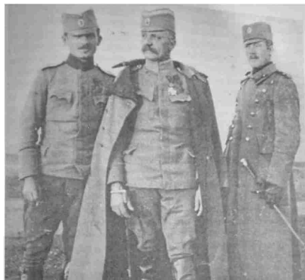
▲ ИЗУЗЕТАН Живојин Мишић са саборцима

друга генерација сељака, желела да понизе да би се више осећала грађанима. Мишић је одабрао